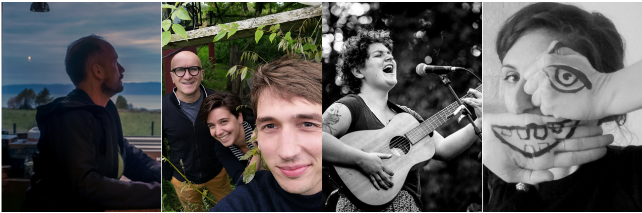
Olivier Villanove ; Titus, Margot et Charles ; Clara Malaterre