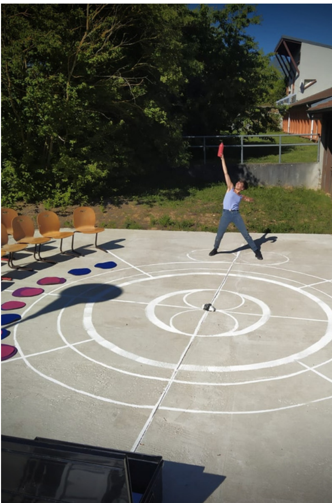
Représentation extérieure en lycée - La-Queue-lez-Yvelines (78)

Le 9 juillet 2023 : 1 représentation en extérieur (ancien prieuré d'Azay-le-Brûlé) en clôture du festival Traverses (79).