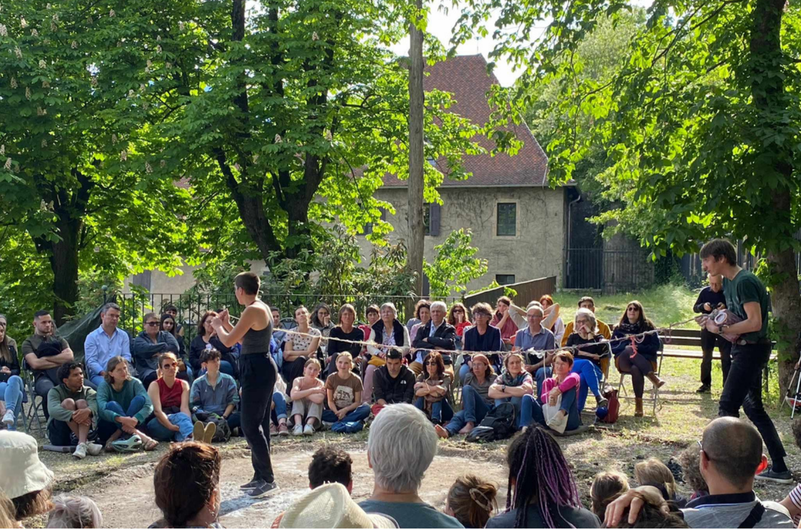
© La Cour des Contes - Représentation lors du festival Les Arts du Récit - Musée Dauphinois à Grenoble (38)